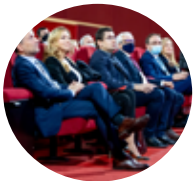
Laureaci Rankingu Gmin Dolnego Śląska