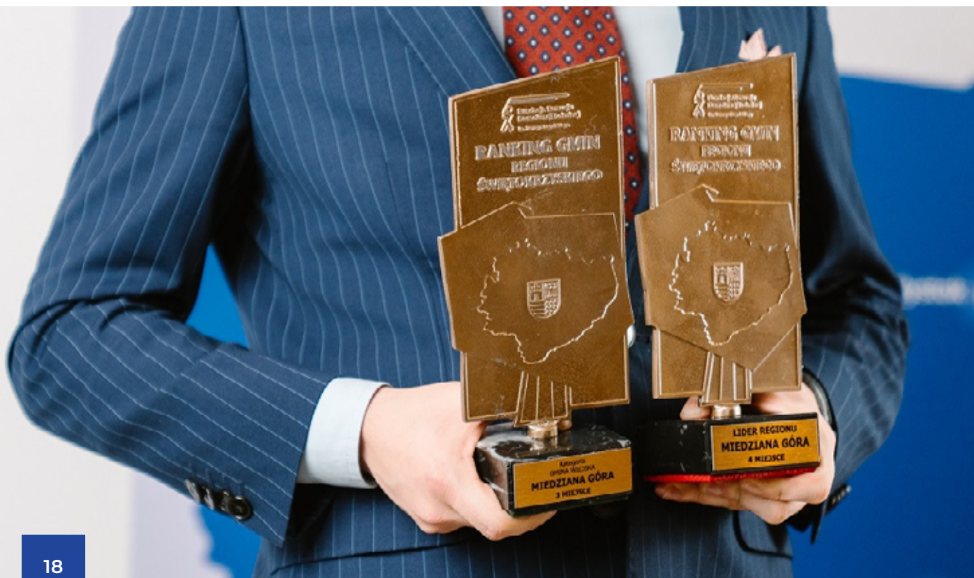
Nagroda Rankingu Regionu Świętokrzyskiego

W sumie przyznano 22 wyróżnienia. W kategorii Lider Regionu zwyciężyła gmina Nowiny.